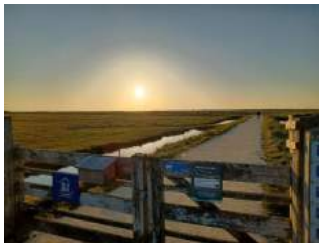
Sentier des Polders, créé en 2001