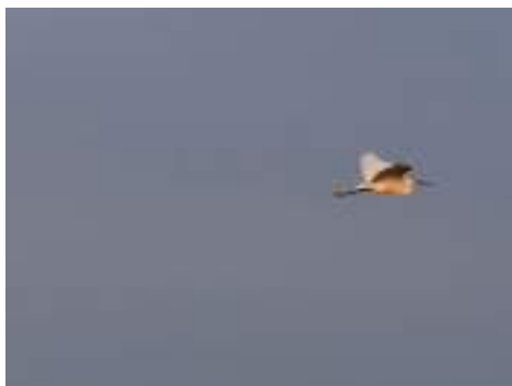
Aigrette garzette à la réserve naturelle de Moëze-Oléron