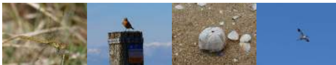
Sympetrum sp, Traquet motteux, Oursin des sables, Avocette élégante à la réserve naturelle de Moëze-Oléron